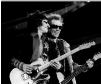
Rock (The Rolling Stones)